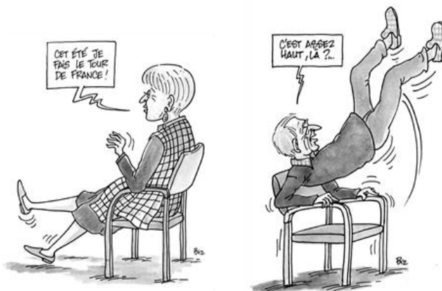
Petits mouvements de confort et de bien-être

Et tout au long de l'année nous fêterons les 10 ans de l'association.